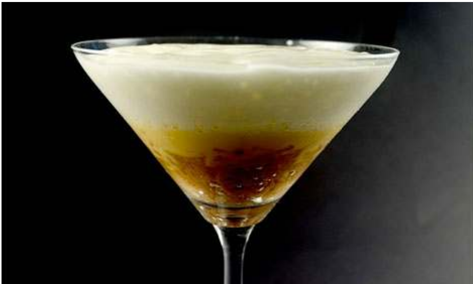
Déconstruction de l'omelette de pommes de terre